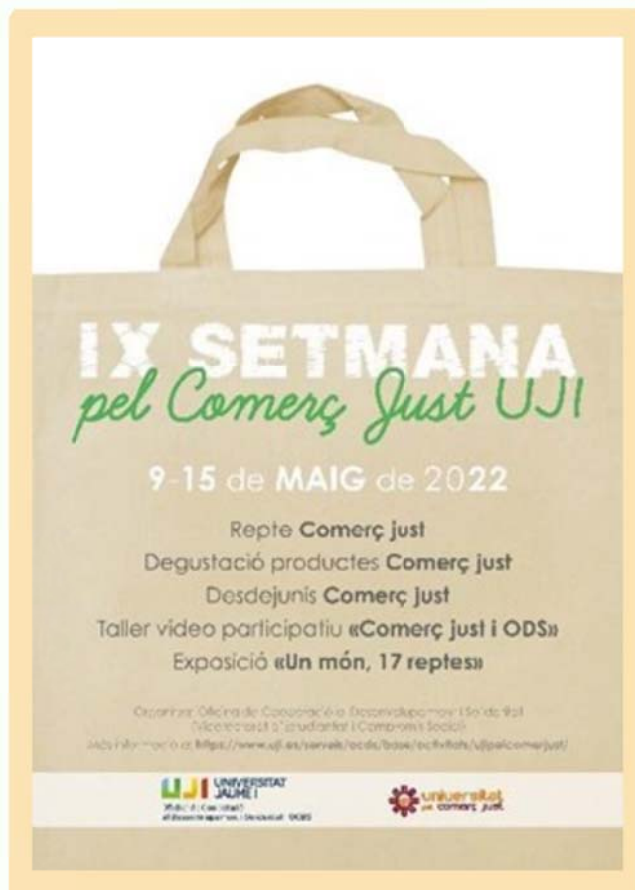
Imatge 9. Cartell de la IX Setmana del Comerç Just de l'UJI