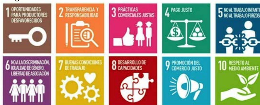
Imagen 1. Los 10 criterios del Comercio Justo.