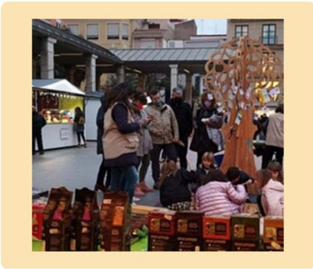
Imatge 4-8. Fotografies de les fires del Dia Mundial de Comerç Just (2017-2022)