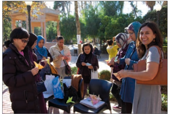
El projecte Sara, un any més present al Ribalta