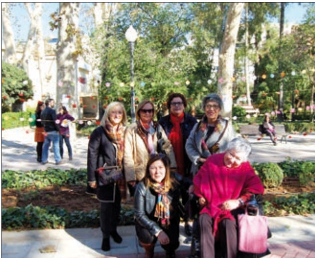
Aula Debate va portar les seues flors des del Grau