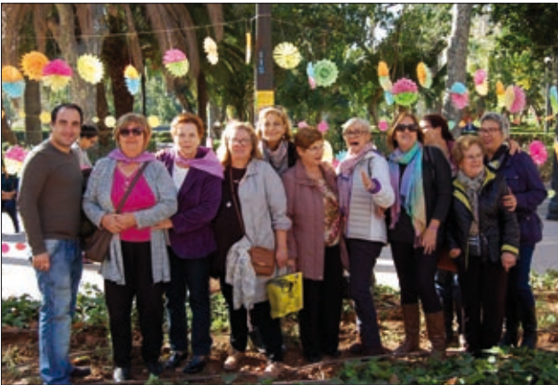
L'associació 8 de Març davant les flors que va preparar