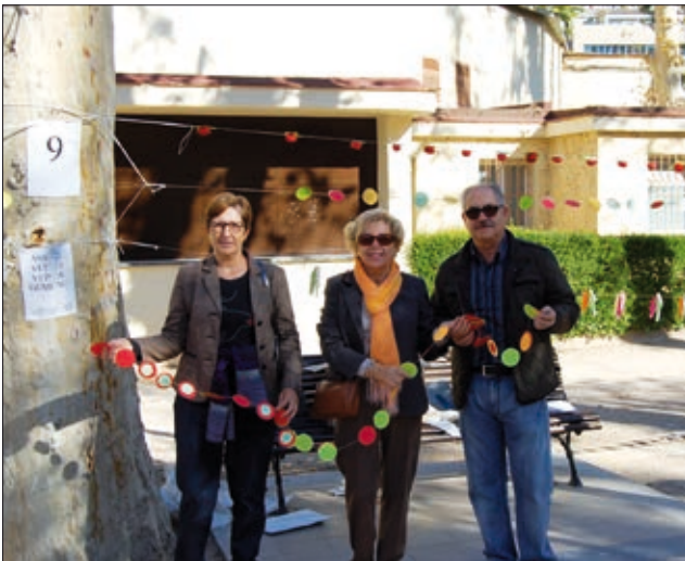
Els veïns i les veïnes de Gumbau, sempre molt participatius