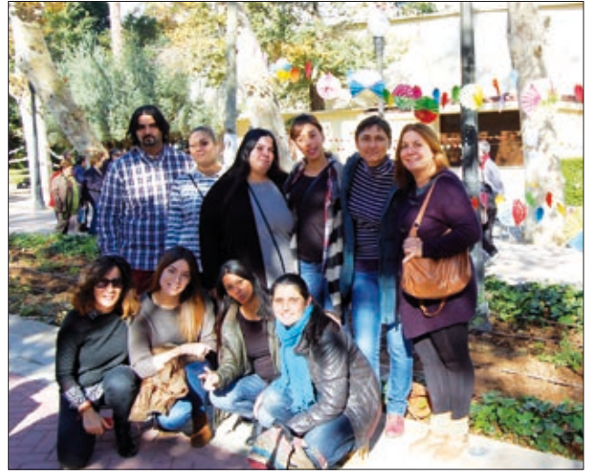
Secretariado Gitano no es va voler perdre la cita reivindicativa