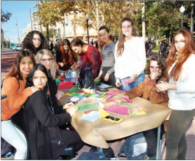
Alumnat de l'Escola d'Art va participar tot el matí