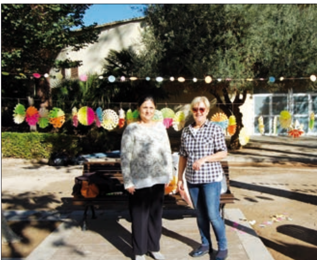
Adona't també va decorar un arbre amb flors