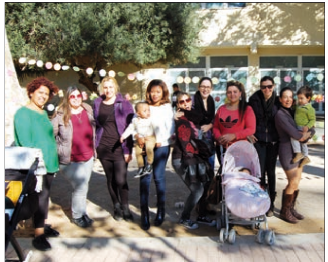
Un grup de dones de Provida amb les seues flors