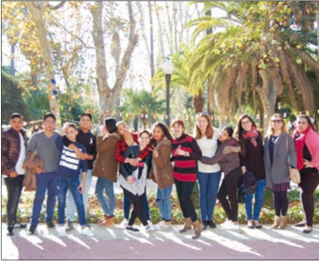
Els joves d'Spam van tindre un paper molt actiu