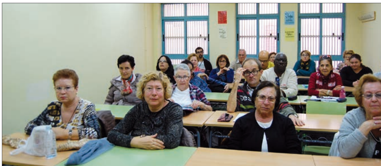
Alumnat de l'EPA Germà Colón, durant la sessió de formació en violència de gènere

34 entitats de diferent naturalesa (veïnals, jubilats i jubilades, dones, IES...) han rebut formació en violència de gènere durant el mes de novembre