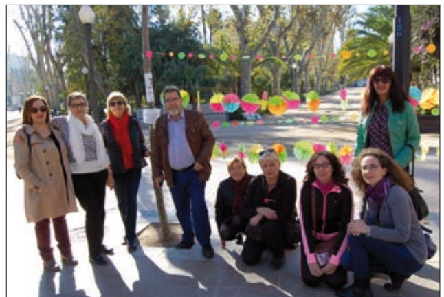
L'Associació de veïns i veïnes Primer Molí