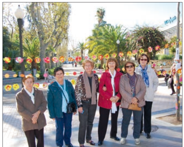
Les dones del Centre Femení de Cultura Popular