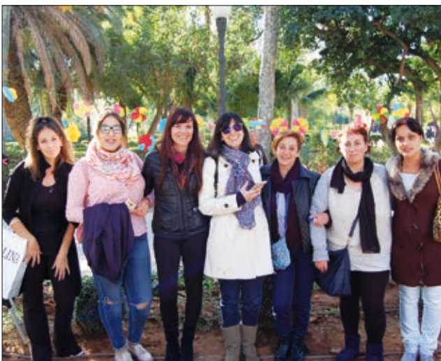
Els grups de dones joves també van estar presents