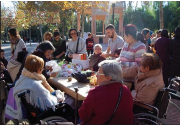
L'Associació Ateneu va elaborar flors al Passadís