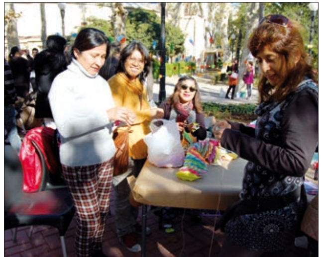
L'Associació de Dones Migrades, Amuinca