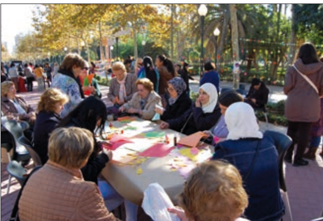
Al llarg del matí es van fer flors de paper