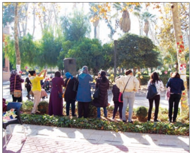
Centenars de persones es van convocar al Passadís de les Arts