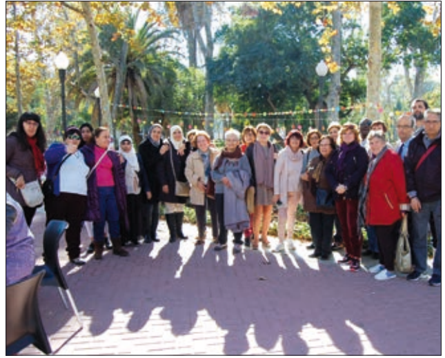
Alumnat de Creu Roja, al finalitzar l'activitat