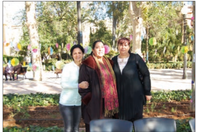
L'Associació de Dones San Lorenzo